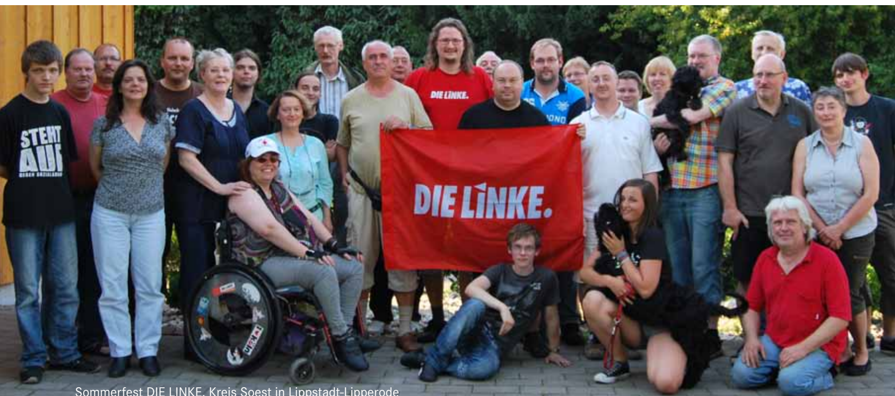
Sommerfest DIE LINKE. Kreis Soest in Lippstadt-Lipperode