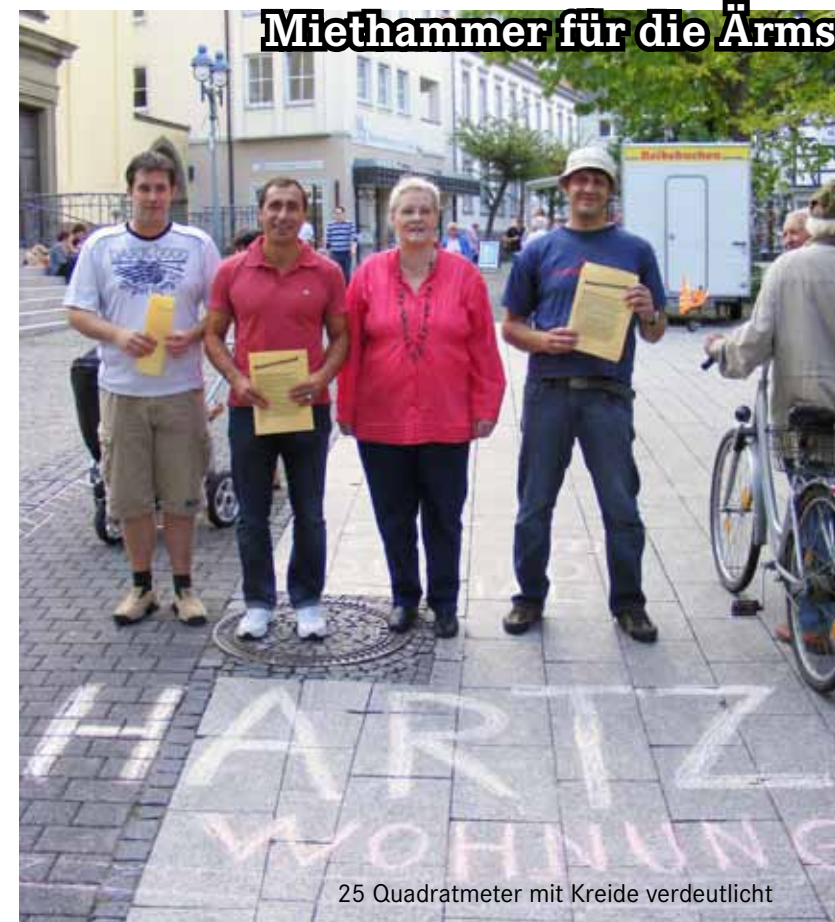
25 Quadratmeter mit Kreide verdeutlicht

WERL Hartz-IV- und GrundsicherungsempfängerInnen droht ein Miethammer. Nach der Empfehlung einer Expertengruppe des Arbeitsministeriums sollen die Kommunen künftig selbständig in Satzungen bestimmen, welche Mietkosten sie Hartz-IV- und GrundsicherungsempfängerInnen bezahlen. So könnte der Wohnungsanspruch für Alleinstehende auf nur 25 Quadratmeter beschränkt werden. Das geht aus einer Antwort der Bundesregierung hervor. Derzeit gilt ein Richtwert von 45 Quadratmetern. Zahlreiche Betroffene wären gezwungen eine andere Wohnung zu suchen. DIE LINKE kritisiert, dass die Zuständigkeit auf die kommunale Ebene abgeschoben werden soll, statt dass der Bund seiner Verantwortung nachkommt. DIE LINKE. Werl sagt NEIN zum Sozialabbau und leistet auf kommunaler Ebene konsequent Widerstand gegen diese Pläne!