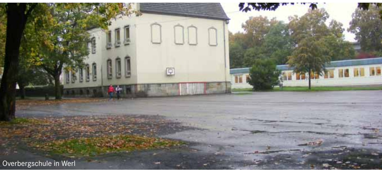
Overbergschule in Werl