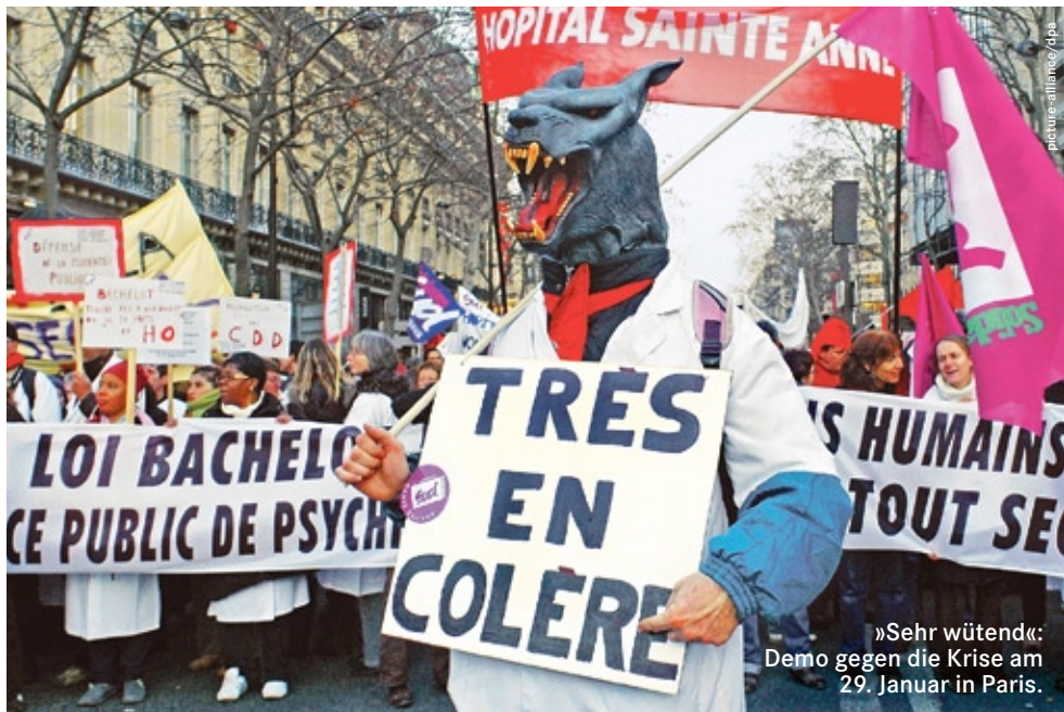
»Sehr wütend«: Demo gegen die Krise am 29. Januar in Paris.