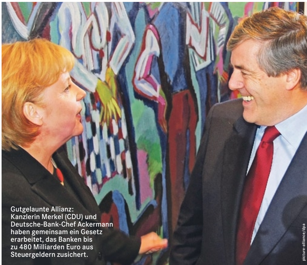
Gutgelaunte Allianz: Kanzlerin Merkel (CDU) und Deutsche-Bank-Chef Ackermann haben gemeinsam ein Gesetz erarbeitet, das Banken bis zu 480 Milliarden Euro aus Steuergeldern zusichert.

Hätte die Bundesregierung so ein Programm bereits vor einem Jahr umgesetzt, müssten heute Hunderttausende Menschen nicht um ihre berufliche Existenz bangen. Der Vorschlag der Partei DIE LINKE ist mehr als die kurzfristigen Konjunkturprogramme der Bundesregierung, die nach zwei Jahren auslaufen. Er garantiert dauerhaft mehr Personal und höhere Qualität in Kindertagesstätten, Schulen, Krankenhäusern, Pflegeheimen.